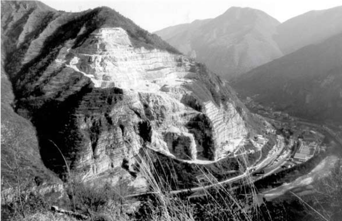
La cava miniera di Carpanè a San Nazario, nel Canale di Brenta, sito estrattivo ad alto impatto paesaggistico, di cui viene contestato il progetto di ampliamento quarantennale.

in cui si distinguono battaglie contro problemi d'inquinamento prodotti da industrie già esistenti, e opposizioni alla realizzazione di nuove aree produttive ritenute nocive o esteticamente deturpanti.