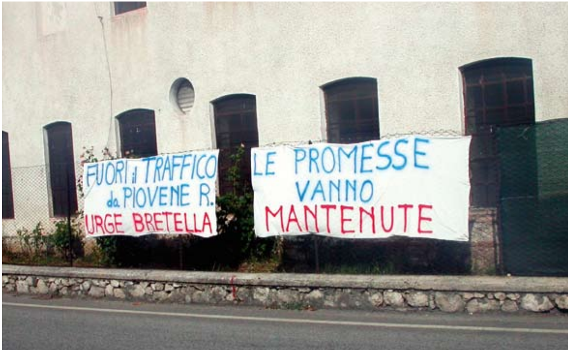
Lenzuola di protesta contro il traffico e a favore della bretella attorno a Piovene Rocchette: il problema delle infrastrutture e dei trasporti è uno dei temi caldi di conflitto

prima ancora che di crisi ambientale si tratta del serpeggiare di una più profonda crisi sociale e culturale, che coinvolge il modo di intendere lo sviluppo del territorio, lo strumento di delega democratica, la necessità di adeguate forme di giustizia sociale, il rapporto affettivo con i luoghi e il paesaggio. A ben vedere, l'ideale di uno sviluppo territoriale qualitativo, sostenibile, fonte di felicità individuale e collettiva proposto dalla Regione del Veneto (cfr. Anastasia, 2005) è lo