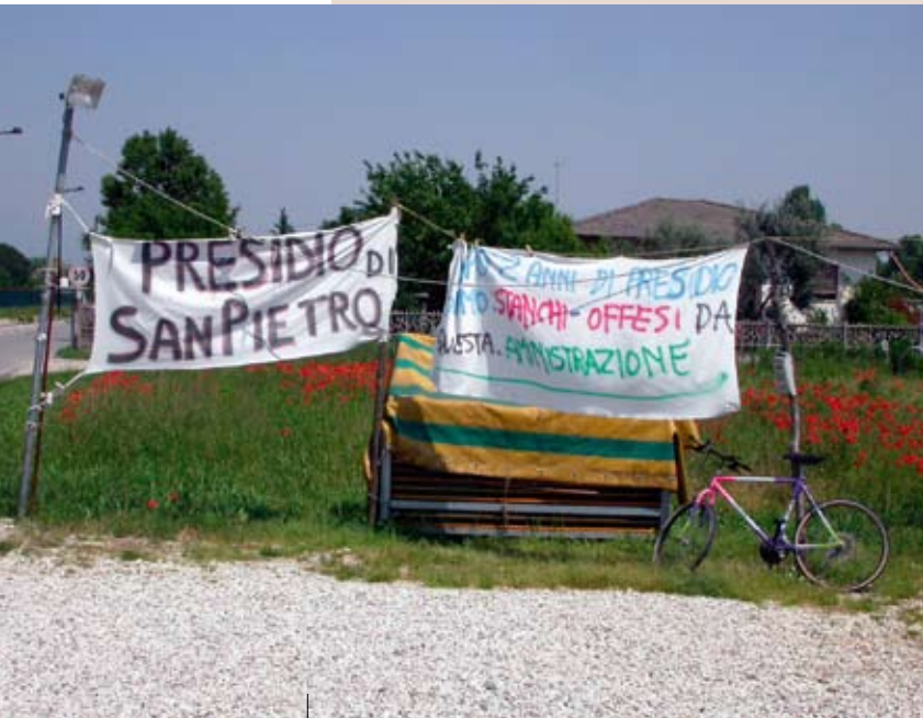
Lenzuola di protesta nei pressi della sede del Presidio di San Pietro di Rosà, divenuto caso mediatico nazionale (foto M. Varotto, 2004).

Il principale obiettivo che si pongono i comitati è in genere quello di fermare la realizzazione di un certo progetto (far chiudere una fabbrica, impedire una discarica, chiedere la rimozione di un'antenna, ecc.), attraverso la sensibilizzazione della popolazione locale circa la problematica affrontata, cercando quindi di coinvolgerla nell'attività del comitato. Per il primo obiettivo i comitati a seconda della gravità della questione affrontata agiscono promovendo interpellanze e mozioni in consiglio comunale, inviano esposti alla Magistratura o alla Procura, presentano osservazioni alle commissioni VIA, raccolgono firme per la presentazione di proposte di legge al Parlamento e altre vie legali. In caso di decisioni già prese dalle amministrazioni pubbliche molti comitati presentano (a volte ripetutamente) ricorsi al TAR.