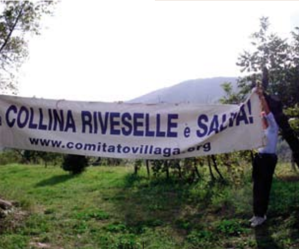
Manifestazione del Comitato Villaga contro il progetto di cava nella collina delle Riveselle, una delle battaglie sostenuta dal comitato con esito favorevole.

In genere i comitati nascono allo scopo di far fronte ad un'emergenza e cessano di esistere quando il motivo di contestazione viene meno, nell'arco di pochi mesi o fino a qualche anno. Sia in caso di vittoria che di sconfitta (in ambito vicentino circa 1/3 dei comitati ha visto coronata di successo la propria battaglia: 11 casi su 39), i comitati tendono a rimanere attivi anche una volta superata la fase emergenziale. Dal 1998 ad oggi emerge infatti una tendenza alla stabilizzazione di questi movimenti, che allargano la loro sfera d'interesse a più problematiche ambientali o sociali, avviando contatti con altre componenti della società civile e svolgendo il ruolo di “sentinelle” sul territorio. Negli ultimi anni è cresciuta la tendenza da parte di comitati singoli, spesso isolati nella loro protesta, ad aggregarsi, a fare rete, a coordinarsi con altri comitati. Il coordinamento assume un'importante funzione ‘terapeutica’: è di grande conforto per le persone che partecipano alle attività di un comitato il confrontarsi con altri che vivono lo stesso problema, affrontare insieme ostacoli comuni. In tal modo si punta anche ad ottenere maggiore visibilità e forza d'urto rispetto alle decisioni che riguardano il territorio.