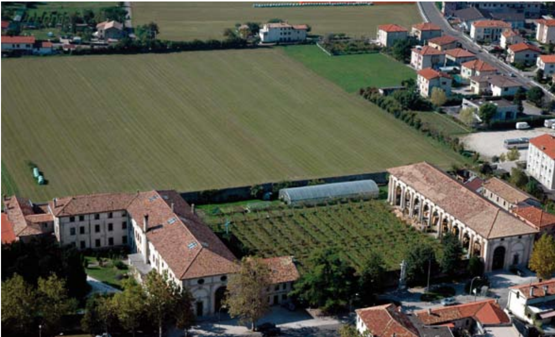
Il Monastero di San Giacomo di Veglia, a Vittorio Veneto, eletto luogo del cuore dal FAI per contrastare il progetto di lottizzazione del brolo (foto Bastiani, 2007).

molti conflitti riguardanti le cave nell'area berica, i comuni appoggiano attivamente le istanze dei comitati mentre Regione e Provincia risultano spesso dalla parte dei cavaatori.