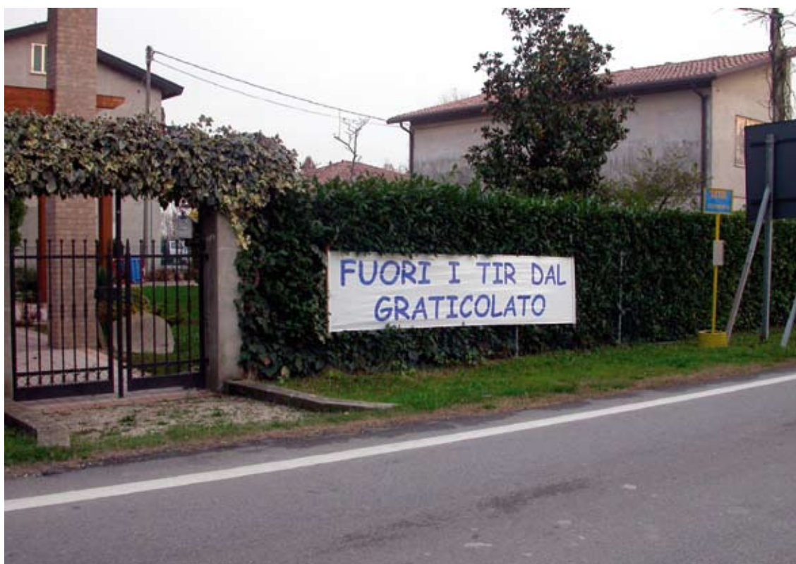
Lenzuola di protesta contro il traffico pesante nella delicata maglia viaria del Graticolato Romano